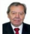
Muñoz Ledo Porfirio G.P.: MORENA Entidad: Ciudad de México Circ.:4 Curul: H-273